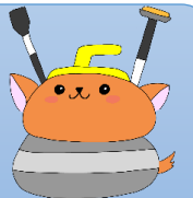
イメージキャラクター 「しかとん」